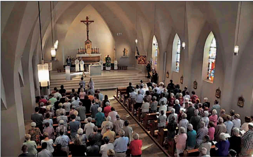
Messfeier zur 1050-Jahr-Feier in 2017.