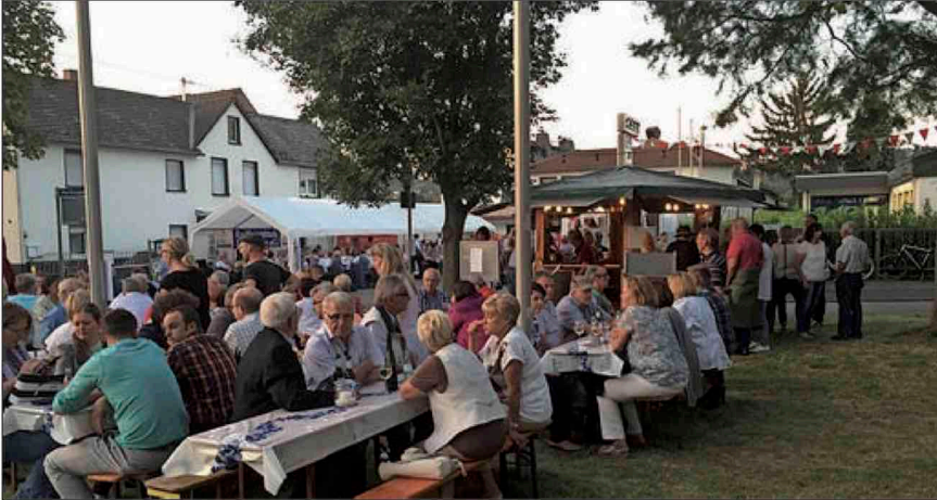
In Kesselheim sind die Festivitäten stets sehr gut besucht, wie hier bei der 1050-Jahr-Feier im vergangenen Jahr. Da packen alle Ortsvereine mit an und ziehen am gleichen Strang.