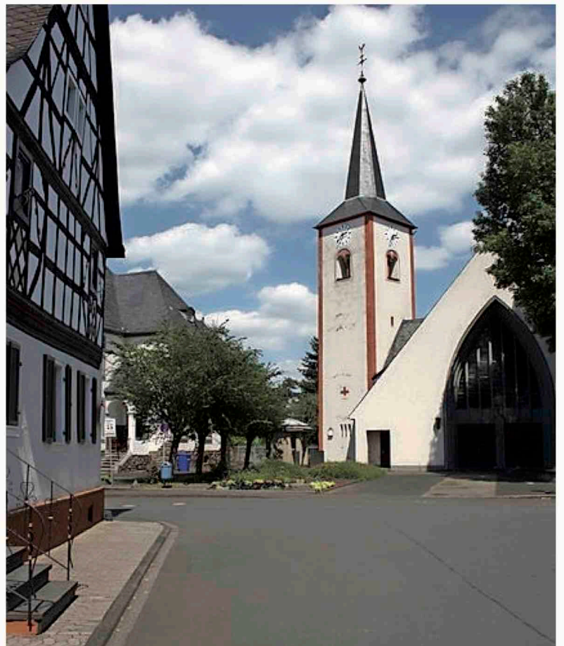
Die Pfarrkirche St. Martin Kesselheim ist ein besonderes Kleinod.